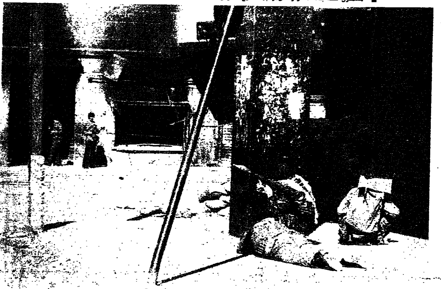
■ مفاريس ومسلحون اتسببوا الاصابات في منطقة الشماخ

استمرار اعمال العنف امس ، انعكس على مختلف المناطق ، وخاصة في بيروت والقواصم التي شهدت ليلة بلغت فيها عمليات القصف اقصى درجاتها . شوارع بيروت كانت شبه خالية بعد سقوط عدد من الضحايا . والمسلحون كانوا متفعلين نسي الأسواق التجارية ، كما استمرت المعارك في محور القطاري - كمينصر - تينيسيا . وقد ادى ذلك الى تصاعد عمليات النزوح من مناطق الاحياء . وكان منظرا غامضا ان تسرى مواطنو يطبع الطريق واكتسبوا هربا من رصاص القناصة الذين يستمر نشاطهم على نطاق واسع . وفي الفجاءة - عين الرمانة ، عادت المفاريس الى الشوارع بعد ان تجددت الاشتباكات في هذه المنطقة على نطاق واسع .